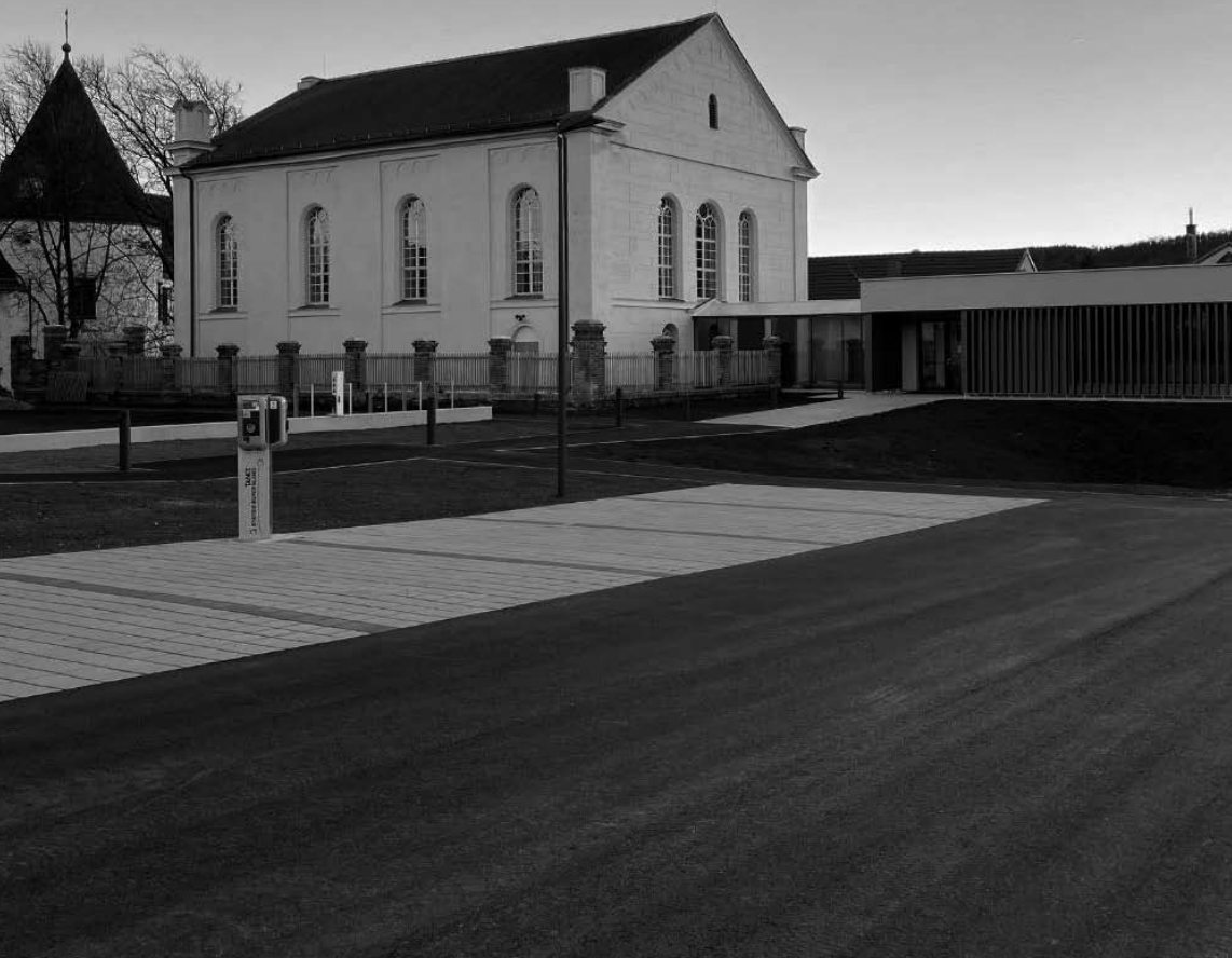
Haupteingang zur ehemaligen Synagoge in Kobersdorf.