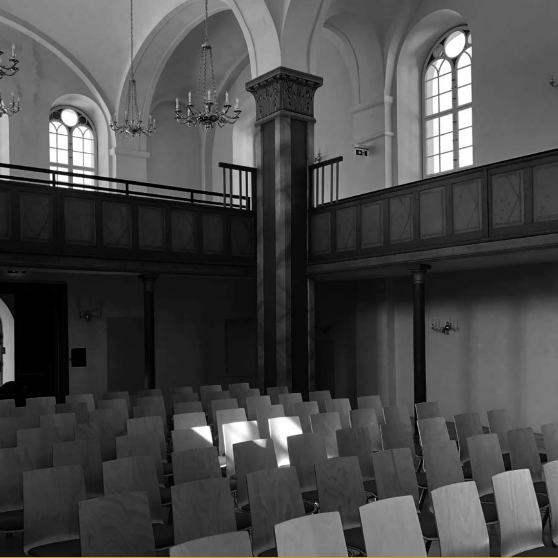
Innenansicht der ehemaligen Synagoge in Kobersdorf.